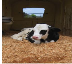
4 石橋ファームランド